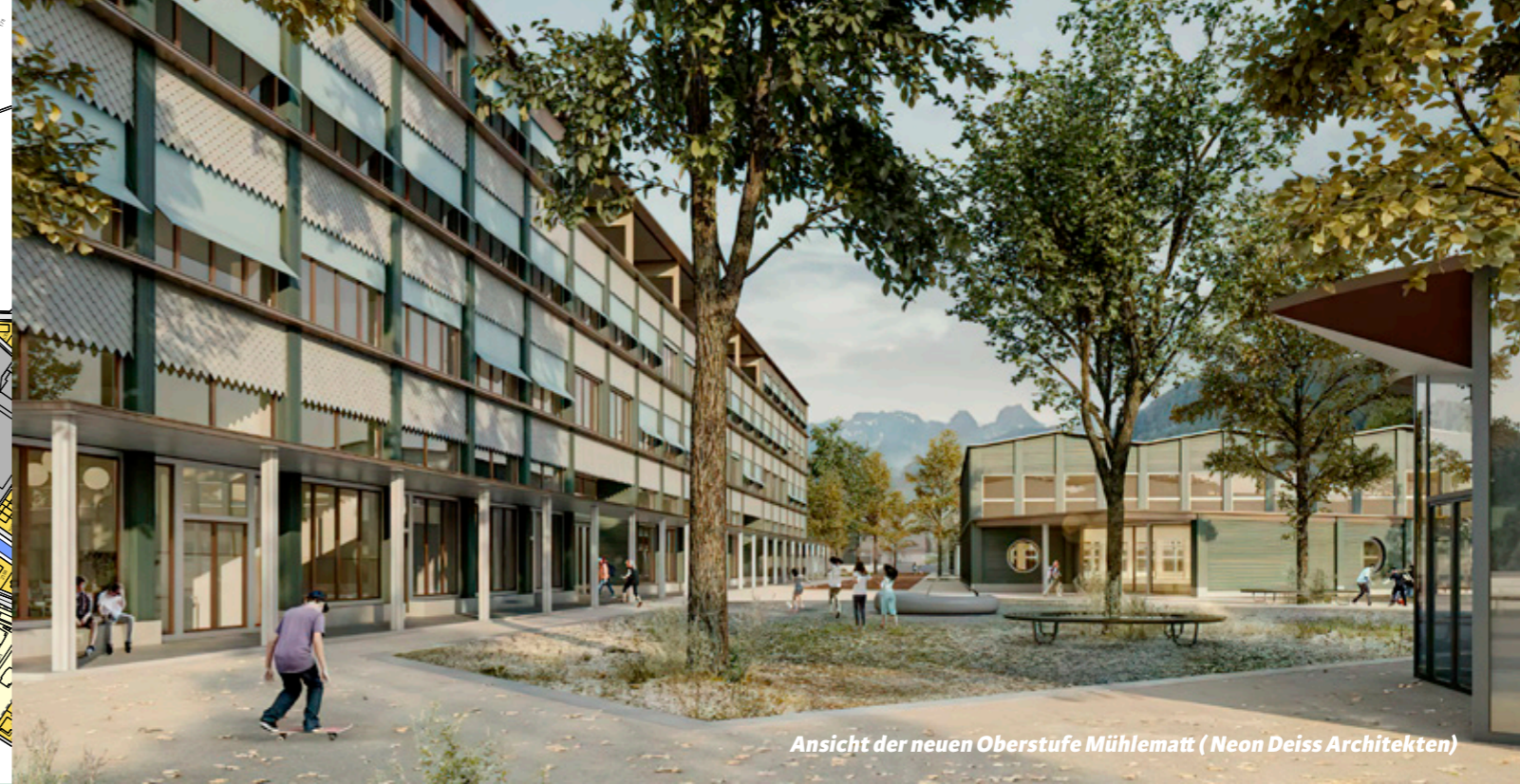
Ansicht der neuen Oberstufe Mühlematt ( Neon Deiss Architekten)