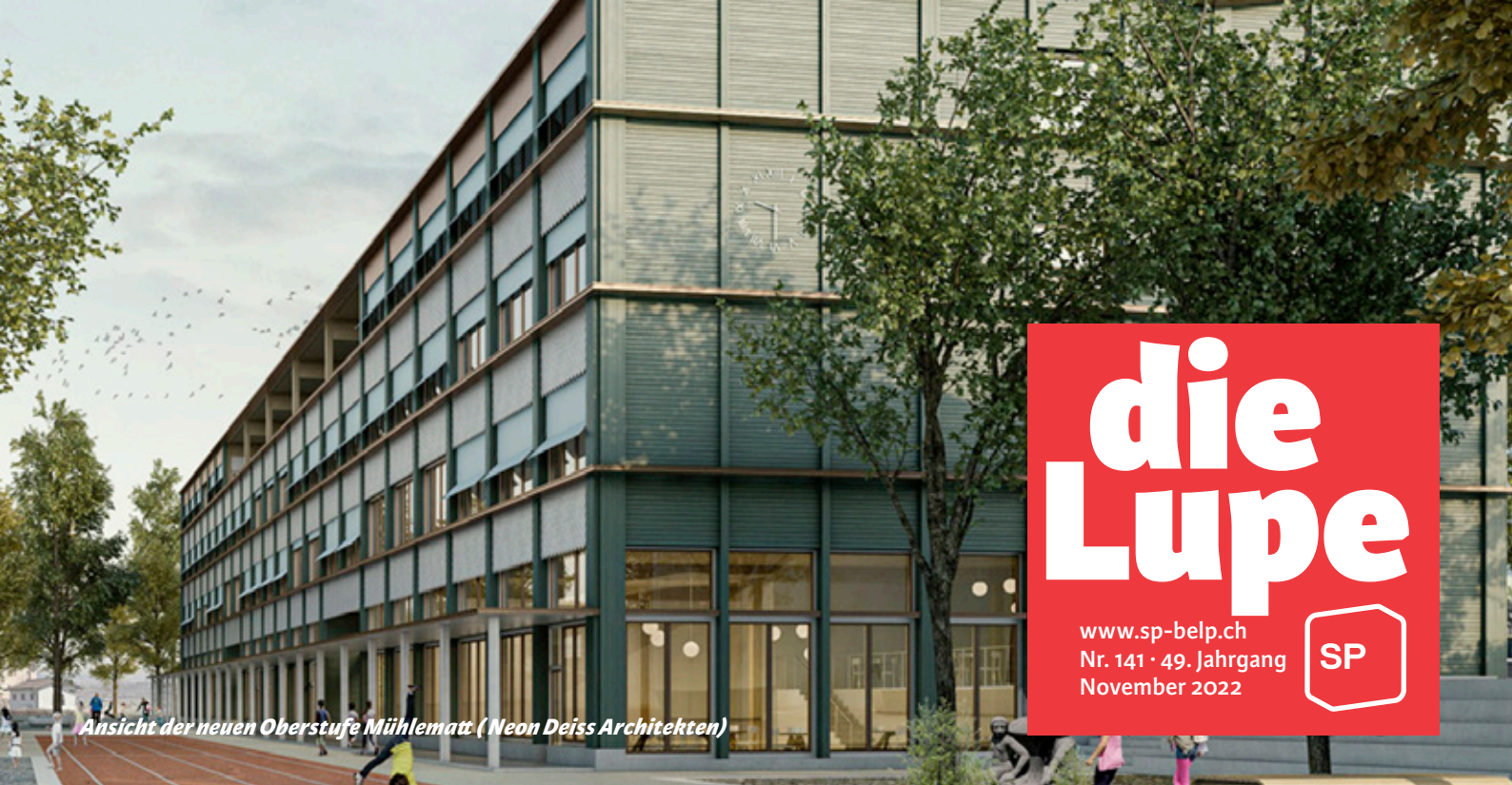
Ansicht der neuen Oberstufe Mühlematt (Neon Deiss Architekten)